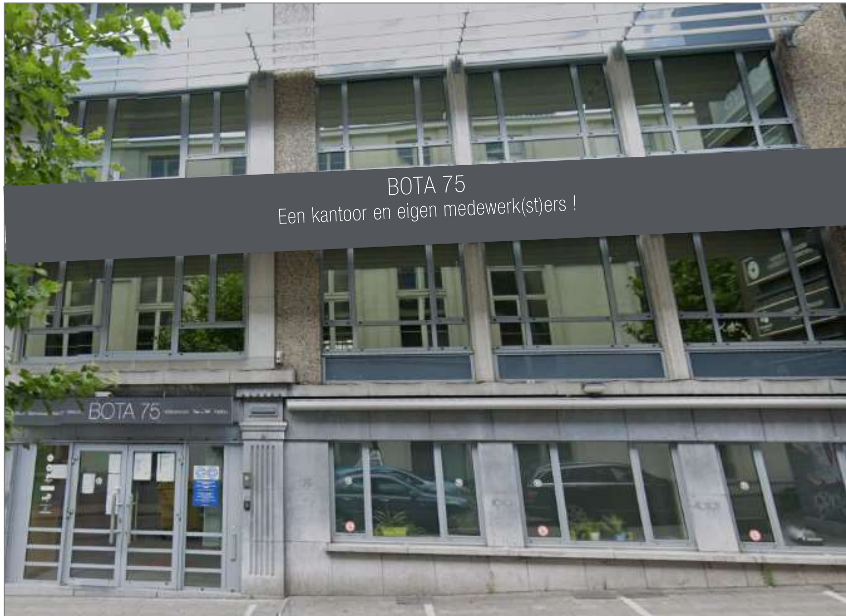
BOTA 75 Een kantoor en eigen medewerk(st)ers !